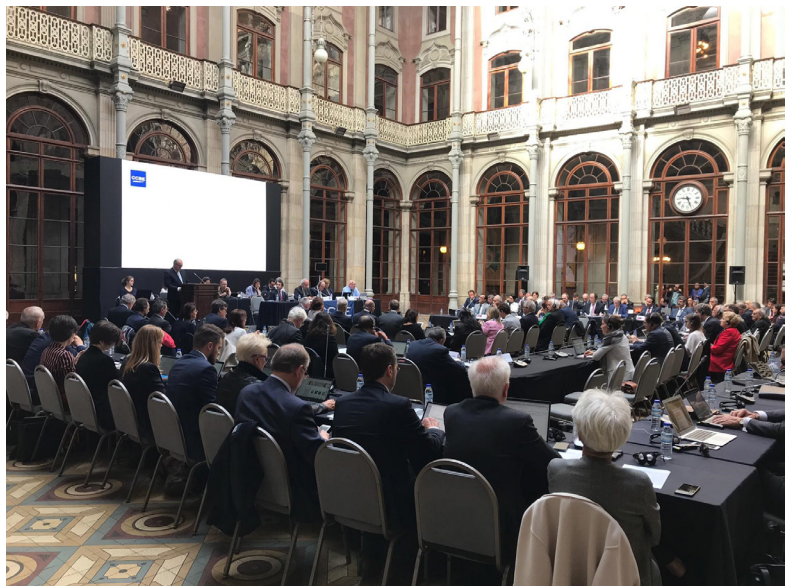
Пленарна седница на ССВЕ во Порто.

Делегациите беа информирани и за најновите вести во врска со заедничкиот Натпревар за млади правници организиран од страна на ERA-ССВЕ. Поднесувањето на пријавите започнува од 1 јуни 2019 година, за натпреварот за 2019-2020 година. Овој натпревар има за цел,